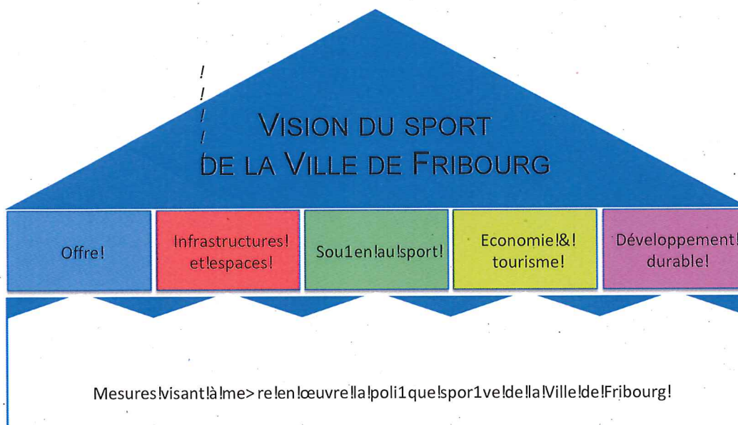
Figure 3 Structure du Concept communal du sport